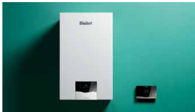
Najbolji odnos cene i radnih karakteristika: Povežite ecoTEC plus uređaj sa regulatorom sensoHOME