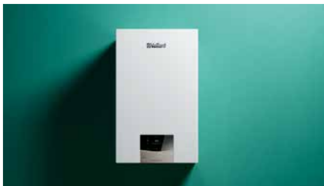
ecoTEC plus VUW

Zahvaljujući njegovoj novoj inteligentnoj karakteristici „IoniDetect“, uređaj potpuno samostalno upravlja promenama u vrsti i kvalitetu gasa. Zagarantovano optimalno sagorevanje, bez dodatnog napora.