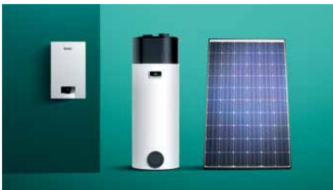
Fleksibilna integracija u sistem

Brza daljinska provera i prilagođavanje uređaja za grejanje putem našeg novog sensoCOMFORT regulatora i aplikacije sensoAPP.